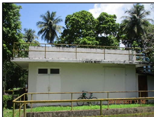
ภาพที่ 2.3 (ต่อ) สถานีสูบน้ำจากคลองกังปลา