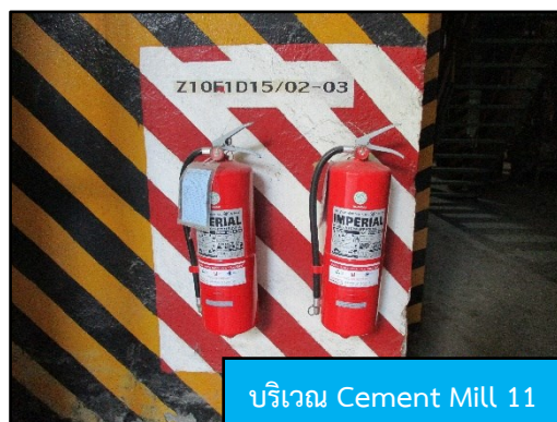
บริเวณ Cement Mill 11