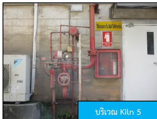
บริเวณ Kiln 5