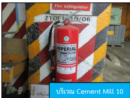
บริเวณ Cement Mill 10