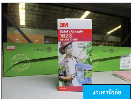
แว่นตานิรภัย