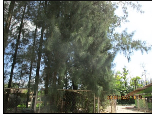
ภาพที่ 2.14 บริเวณพื้นที่สีเขียวภายในโครงการ