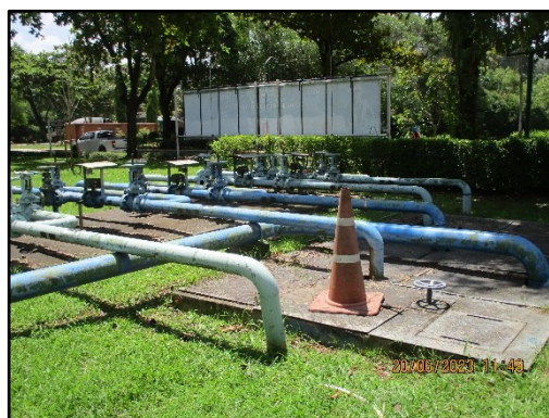
ภาพที่ 2.3 สถานีสูบน้ำจากคลองก้างปลา