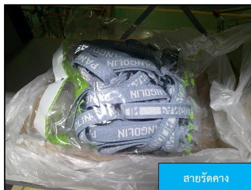
สายรัดคาง