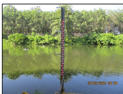
ภาพที่ 2.2 สระน้ำขนาด 200,000 ลูกบาศก์เมตรและมาตรวัดระดับน้ำ