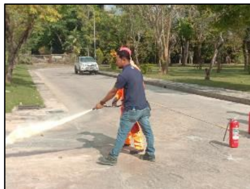
ภาพที่ 2.11 การฝึกซ้อมดับเพลิง