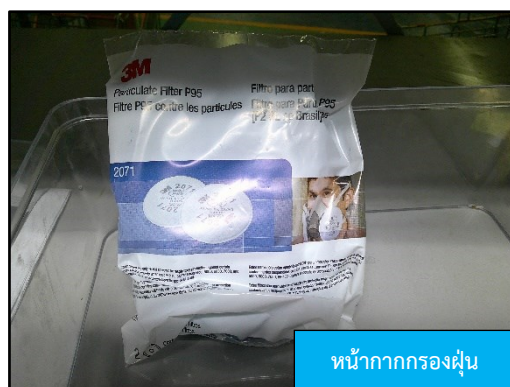
หน้ากากกรองฝุ่น