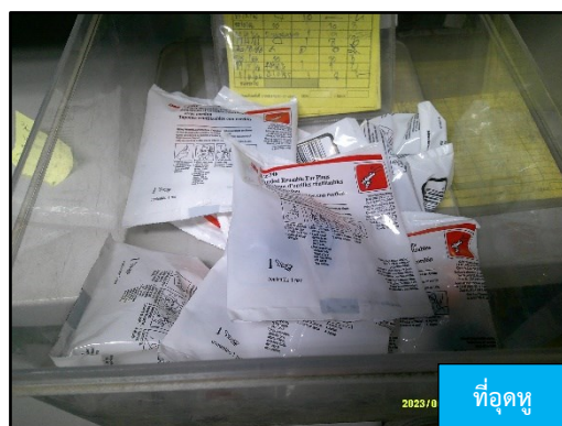
ที่อุดหู