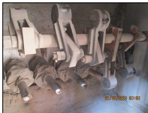
ภาพที่ 2.6 Casing หุ้มชุด Hammering Equipment