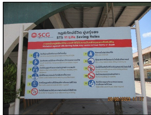
ภาพที่ 2.9 กฎพิทักษ์ชีวิต ปูนทุ่งสง