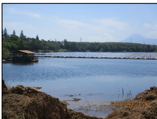
ภาพที่ 2.4 บ่อเหมืองเซลเก่าเพื่อเป็นแหล่งน้ำสำรองของโครงการฯ