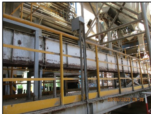
ภาพที่ 2.1 สายพานแบบปิดบริเวณ SP Boiler และ Precipitation Chamber