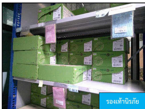
รองเท้านิรภัย