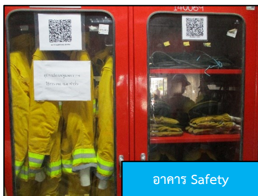
ภาพที่ 2.12 (ต่อ) ระบบดับเพลิงภายในโครงการ