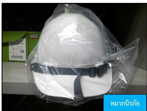
หมวกนิรภัย