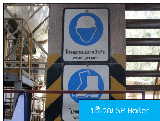
ภาพที่ 2.5 ป้ายเตือนบริเวณที่มีความเสี่ยง และกำหนดให้พนักงานสวมใส่อุปกรณ์ป้องกัน อันตรายส่วนบุคคล