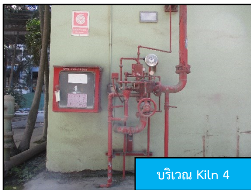
บริเวณ Kiln 4