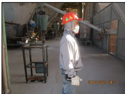
ภาพที่ 2.7 การสวมใส่อุปกรณ์ป้องกันอันตรายส่วนบุคคลขณะปฏิบัติงาน