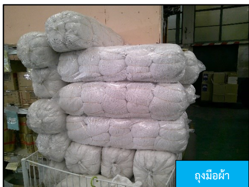
ถุงมือผ้า