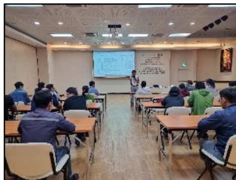
ภาพที่ 2.10 กิจกรรมการอบรมให้ความรู้เกี่ยวกับความปลอดภัยในการทำงานด้านต่างๆ